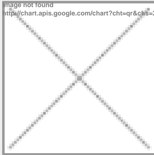
image not found http://chart.apis.google.com/chart?cht=qr&chs=250x250&chld=H|0&chl=https%3A%2F%2Fwww.schnaep

https://www.schnaepchenimmo.de/property/exklusives-ladenlokal-buero-im-aerztehaus-kannengiesserstr/